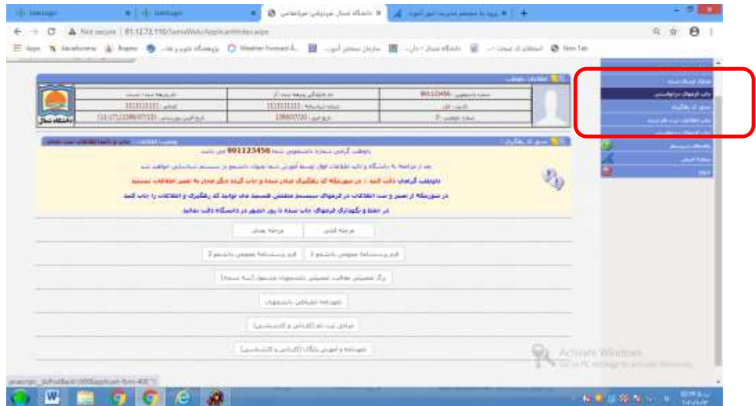
مرحله 6 - دریافت و چاپ کد رهگیری و شماره دانشجویی