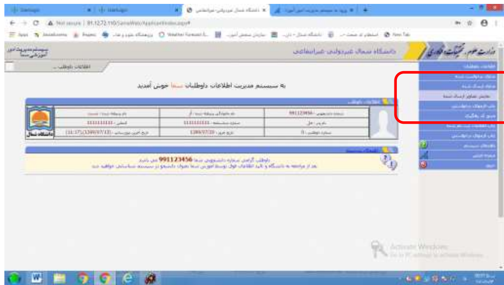
مرحله 5- چاپ فرمهای درخواستی