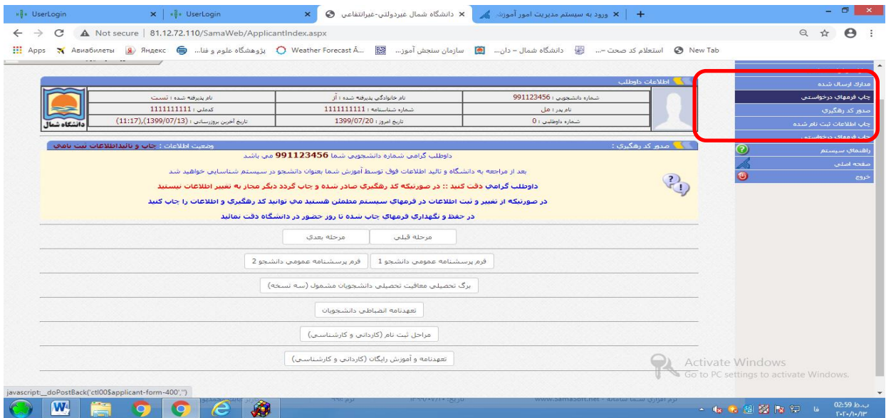
مرحله ۶ - دریافت و چاپ کد رهگیری و شماره دانشجویی