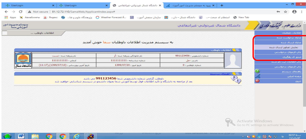
مرحله ۵- چاپ فرمهای درخواستی