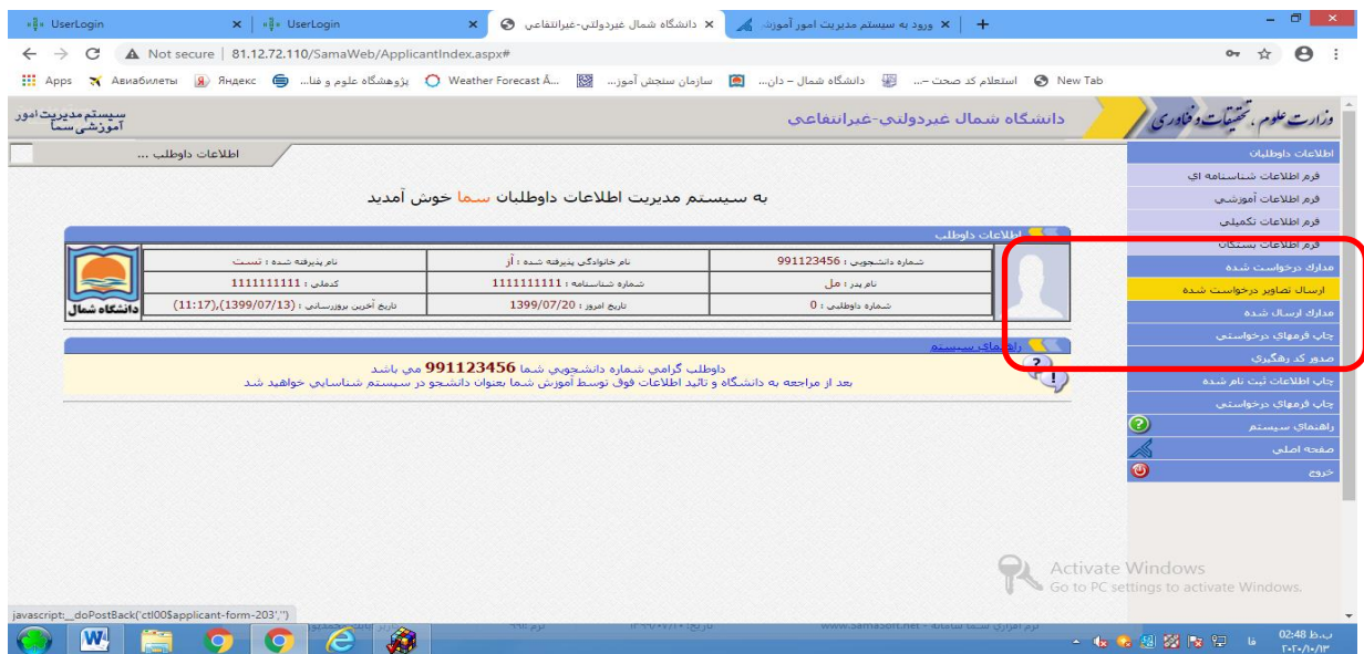
مرحله ۴ - نمایش تصاویر ارسال شده